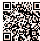
B2 クラルテの換気実験動画