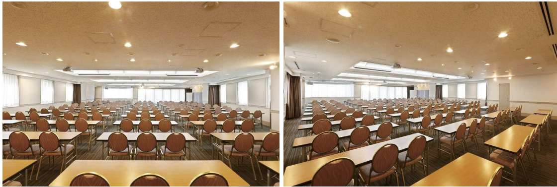
■ 前方中央と会場中頃に天吊りプロジェクターとスクリーンを完備しております。

最上階に位置し、眺望が美しい大会場。晴れた日には富士山まで見渡すことができます。 当館最大のカトレアと併せた会議・宴会のご利用も可能です。